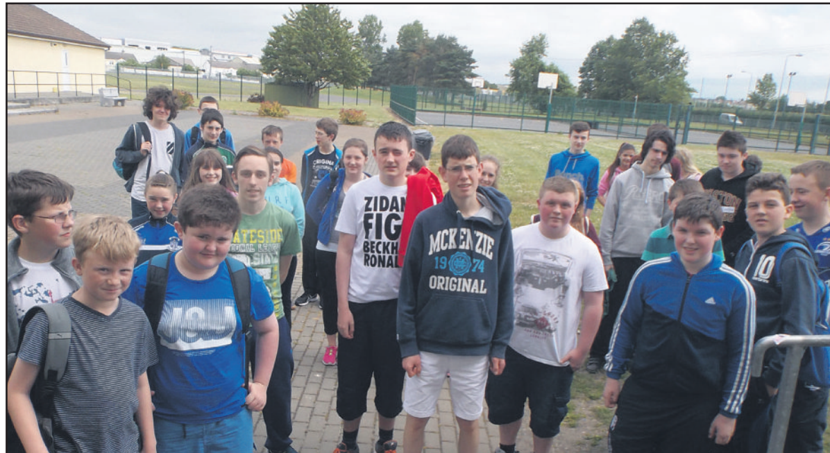
Cuid de na déagóirí ar a mbealach isteach sa Choláiste Samhraidh

Tá an Coláiste Samhraidh do dhéagóirí i gCeatharlach faoi lán seoil. Is í seo an 7ú bliain den choláiste agus tá suas le caoga dalta ag freastal ar an gcúrsa coicise eagraithe ag Glór Cheatharlach agus ar siúl sa Ghaelcholáiste. Tá an cúrsa oiriúnach do dhéagóirí i Rang 6 go Bliain 6 agus leanfar leis go De hAoine na seachtaine seo. Chomh maith leis na ranganna tá cluichí teanga agus díospóireachtaí, cluichí agus sport, amhránaíocht agus ranganna céilí ar chlár an chúrsa.