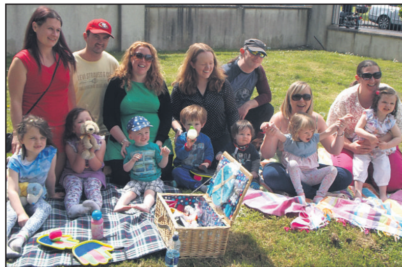
Pic an tSamhraidh ag an ngrúpa SPRAOI anuraidh

Is grúpa dátheangach é SPRAOI a thagann le chéile go rialta chun deis a thabhairt do thuismitheoirí agus páistí súgradh le chéile trí Ghaeilge. Bunaíodh an grúpa i Samhradh 2012 agus tá sé ag dul ó neart go neart ó shin. Bíonn fáilte roimh theaghlach nua i gcónaí agus níl brú ar éinne ach an méid Gaeilge atá acu féin a labhairt. Cuirfear fáilte roimh chách ag Picnic an tSamhraidh ar an Satharn